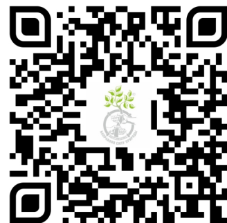
Правила внутреннего распорядка

Правила внутреннего распорядка размещены в каждом отделении в доступном для пациента месте, а также на сайте Центра www.ilizarov.ru в разделе Пациентам/Правила внутреннего распорядка . Там вы найдете следующую информацию: права и обязанности пациента, режим дня, правила посещения пациента, правила приема передач и хранения продуктов, порядок предоставления информации о состоянии здоровья пациента, кто является законным представителем пациента, и правила посещения пациентов священнослужителями.