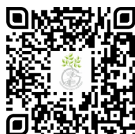
Анкета для пациентов